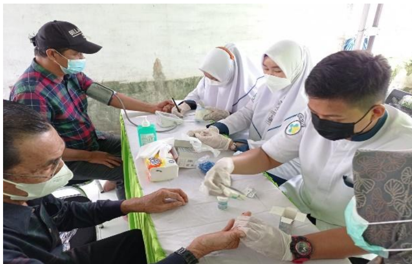
Gambar 3 Pemeriksaan Kolesterol

Rata-rata kadar kolesterol pada pengukuran pertama adalah 241,08 Pada pengukuran kedua setelah dilakukan bekam kadar kolesterol didapat rata-rata adalah 221,46. Hasil analisis disimpulkan ada perbedaan yang signifikan kadar kolesterol antara pengukuran pertama dengan pengukuran ke dua ( p value 0,053 ). Dengan demikian ada ada pengaruh terapi bekam untuk menurunkan kadar kolesterol darah (Faizal et al., 2020; Hidayat et al., 2019; Risniati et al., 2019)