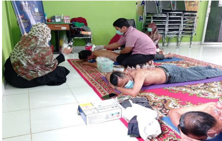
Gambar 2 Terapi Bekam Kering

Rata-rata kadar kolesterol pada pengukuran pertama adalah 241,08 Pada pengukuran kedua setelah dilakukan bekam kadar kolesterol didapat rata-rata adalah 221,46. Hasil analisis disimpulkan ada perbedaan yang signifikan kadar kolesterol antara pengukuran pertama dengan pengukuran ke dua ( p value 0,053 ). Dengan demikian ada ada pengaruh terapi bekam untuk menurunkan kadar kolesterol darah (Faizal et al., 2020; Hidayat et al., 2019; Risniati et al., 2019)