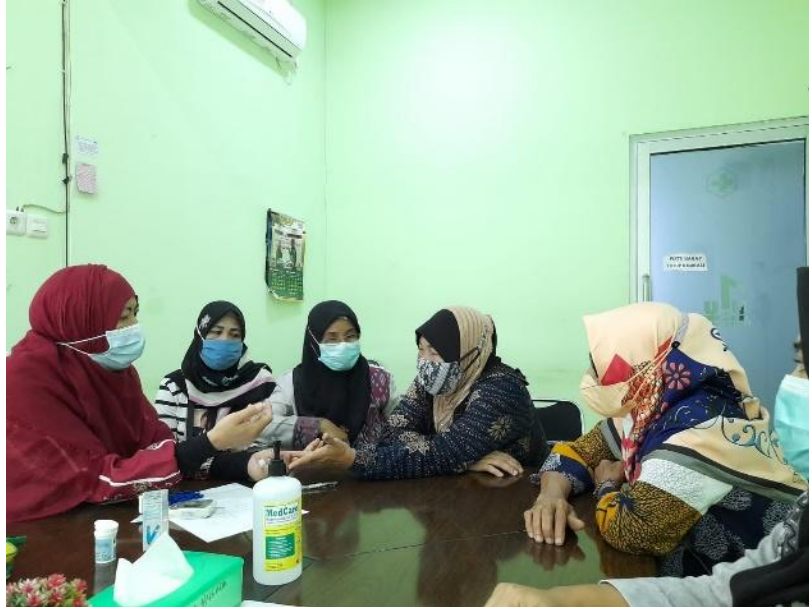
Gambar 4 Pelatihan kader

Pemberdayaan kader sangat penting dalam meningkatkan derajat kesehatan penderita Penyakit Tidak menular. Dalam Panduan Edukasi Kesehatan Masyarakat, kader diharapkan dapat berperan serta dalam memantau status Kesehatan masyarakat. Untuk itu kader perlu dibekali ilmu dan keterampilan khusus dalam melaksanakan perannya ((Dyan & Hidayati, 2016)